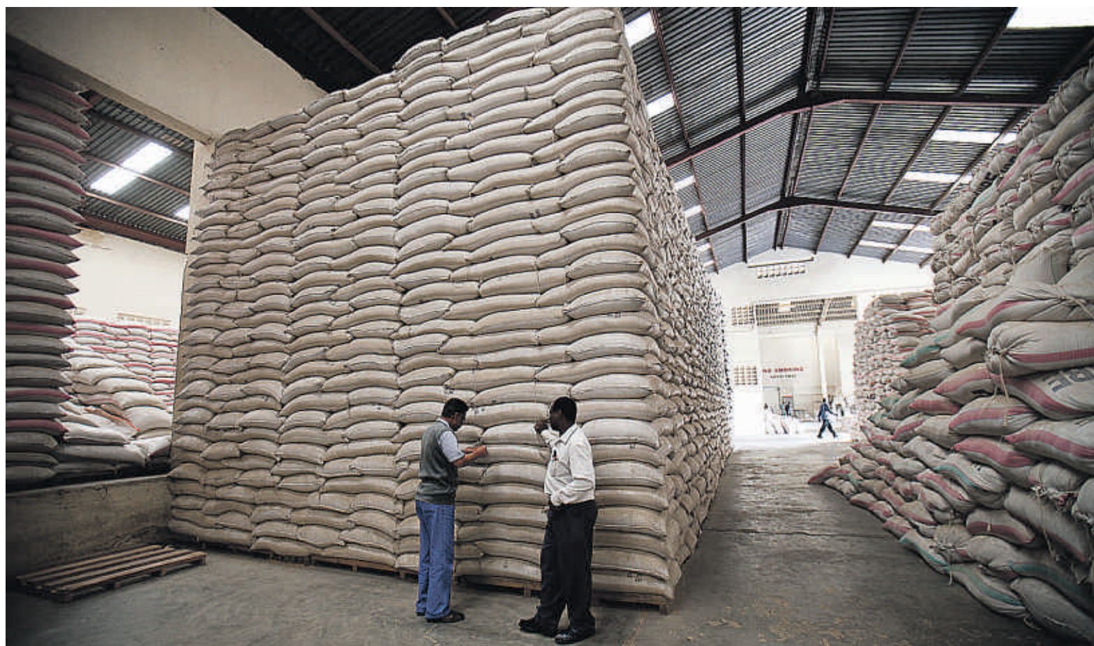
Las Naciones Unidas proyectan para la campaña 2010-2011 una producción de 646 millones de toneladas de trigo, un 5% inferior a la última cosecha

“Es un comportamiento que sólo ha servido para generar